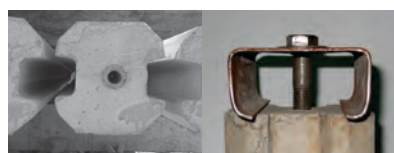
Detalle de Solera

Para mayor información, consulte nuestro Catálogo de Productos PC.