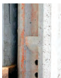
Detalle de Ménsula